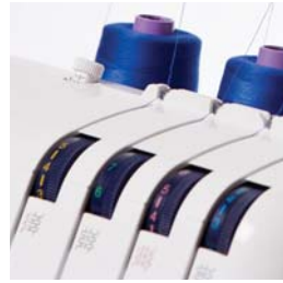
Facile guida all' infilatura con quattro colori