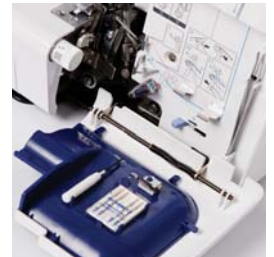
Vano accessori incorporato