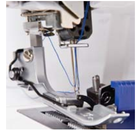
Infilatore automatico degli aghi