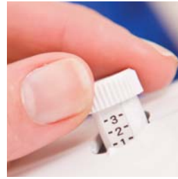
Regolazione della pressione del piedino