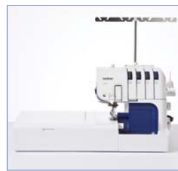
Tavolo di prolunga