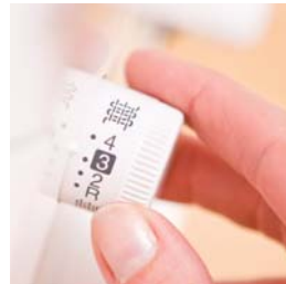
Regolazione della lunghezza del punto